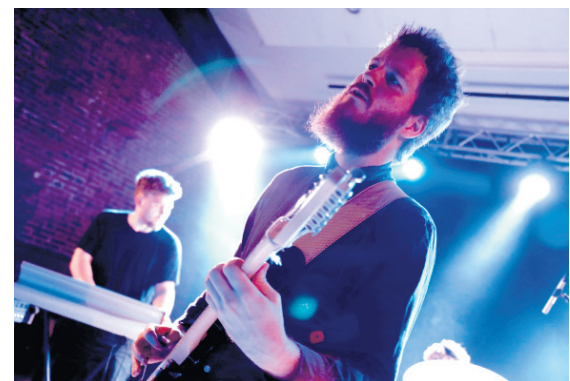
○ Abekejsjer modtog lørdag årets Jazznypris.